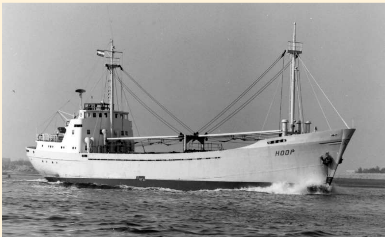
'Hoop' (marhisdata id=2913)