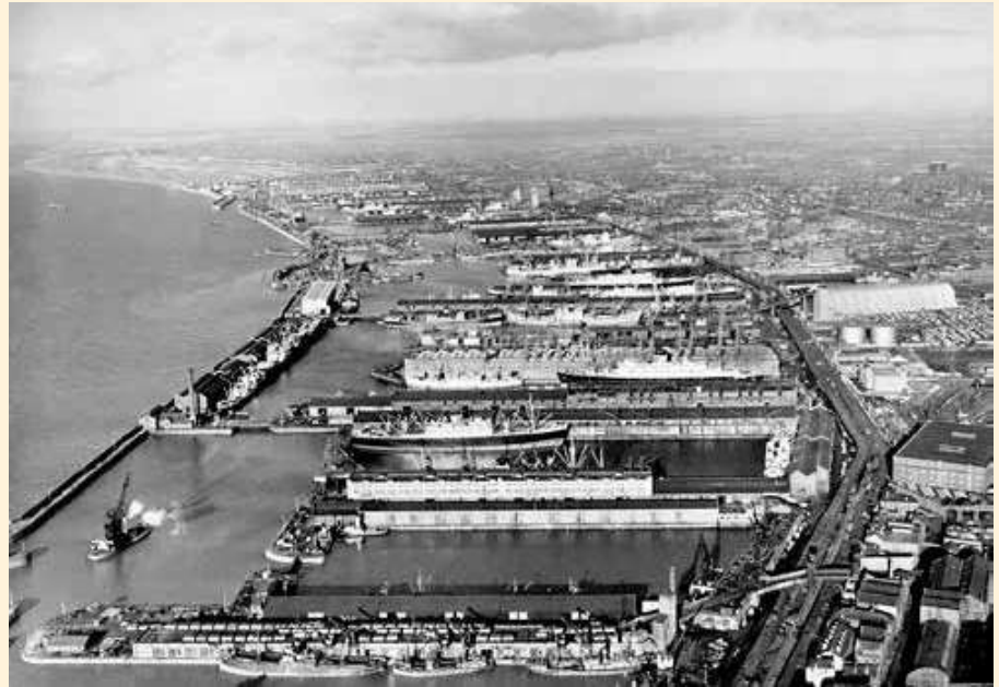
Liverpool begin jaren '60

deden de fans dat ook. Van wat er op het veld gebeurde was zo goed als niets te zien. De Nederlandse coach was Rinus Michels en er waren 56.000 bezoekers.”