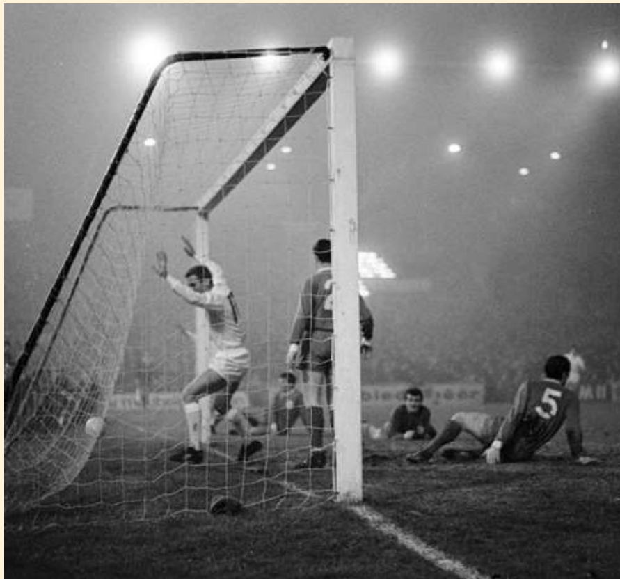
Nuninga maakt 4-0