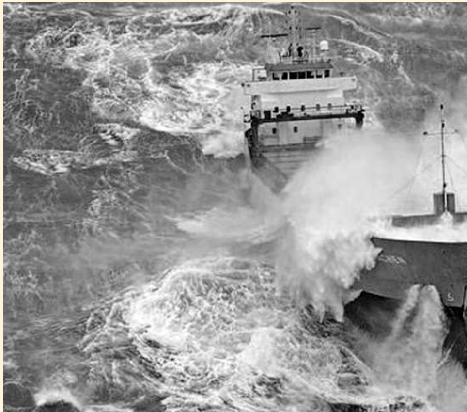
Niet m.s. 'Hoop' maar wel storm

Maar wat had dat met een staking te maken? Ik vroeg hem nogmaals: "Wat is er met Ajax?" Hij wees naar de krant die op zijn bureau lag. Een grote krantenkop schreeuwde over de halve pagina "Ajax beats Liverpool in the fog (5-1)". Toen ik het artikel wat verder doorlas, begreep ik dat Ajax de avond ervoor in het Olympisch stadion, in een dikke mist, Liver-