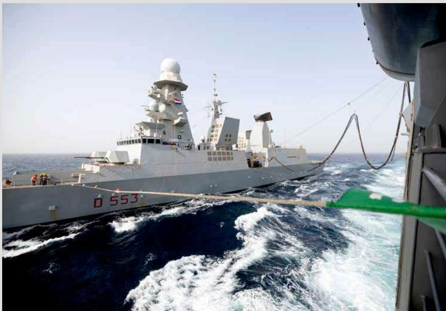
Close up van de Replenishment At Sea