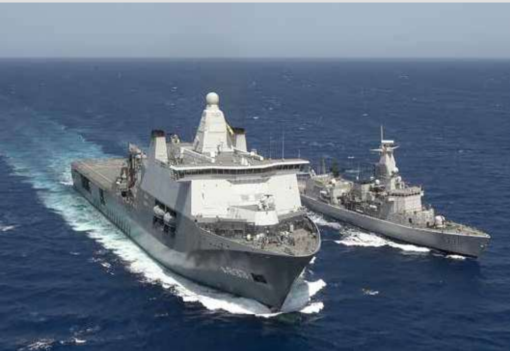
Replenishment At Sea

Zee worden aangevallen. In dit gebied zijn de Houthi-rebellen actief; zij proberen met raketten en drones vanuit Jemen schepen aan te vallen die banden hebben met Israël. Ook maken ze gebruik van onbemande vaartuigen of 'skiffs' - kleine bootjes vol explosieven - die ze