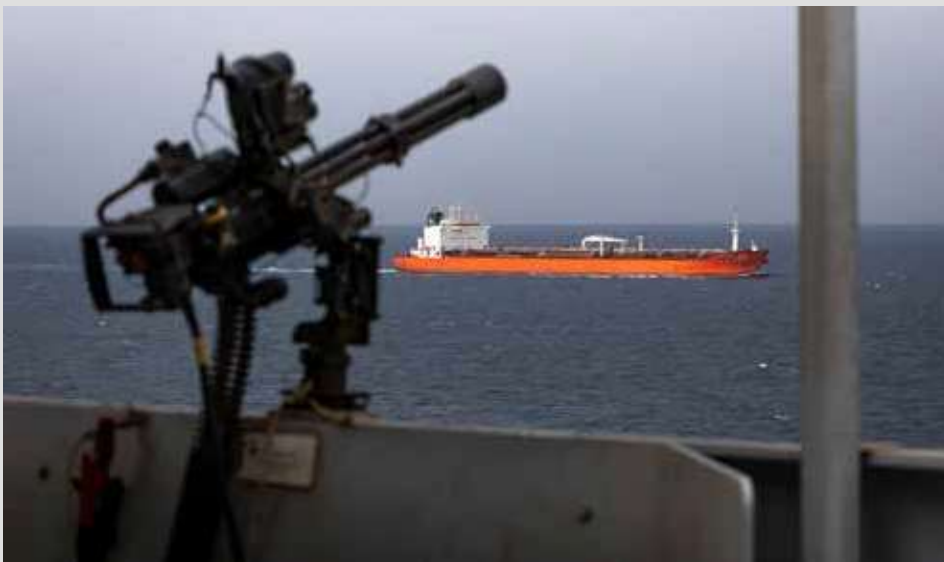
Operatie Aspides

Het is de vroege ochtend van donderdag 25 april 2024. De bemanning van 'Zr. Ms. Karel Doorman' is vroeg opgestaan. De reden: een zware training, georganiseerd door de instructeurs van de Koninklijke Marine, waarbij de passage van de Straat van Gibraltar wordt gebruikt om de situatie in de Straat van Bab al-Mandeb na te bootsen. Bij vertrek zijn de instructeurs aan boord gestapt om de bemanning voor te bereiden op de uitdagingen die hen te wachten staan. Binnen enkele ogenblikken komen de gesimuleerde raketten en drones in actie, en zal het schip en de bemanning alles uit de kast moeten halen om deze, nu nog gesimuleerde, dreiging te weerstaan. Net voordat de territoriale wateren worden binnengevaren, worden de wapens voor de laatste training en checks nogmaals getest.