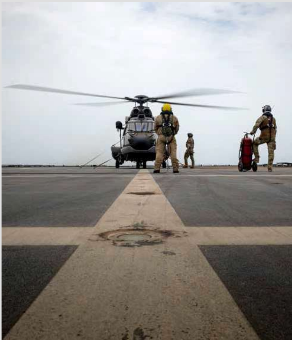
Helikopter op dek

Operatie 'ASPIDES' is een Europese missie die is opgezet om koopvaardij schepen te beschermen die in de Golf van Aden en de Rode